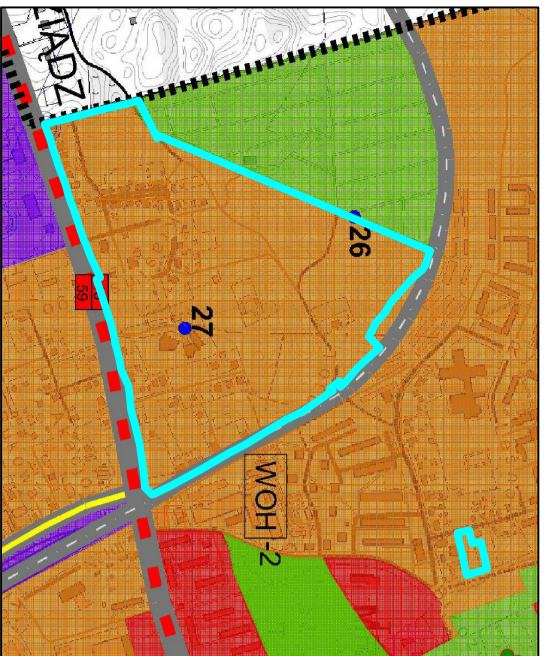
granica opracowania planu