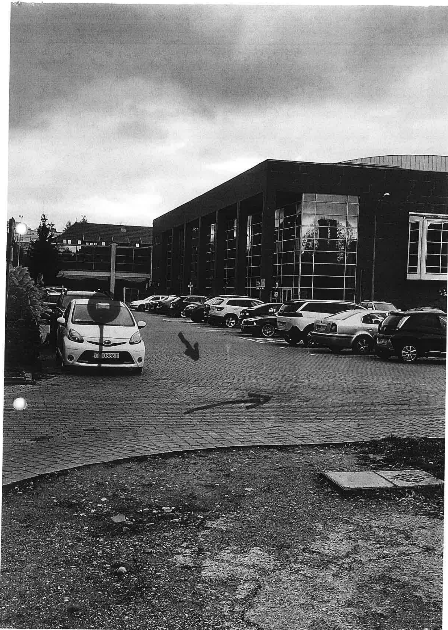
ЗАЕДНО НИК НЕ А